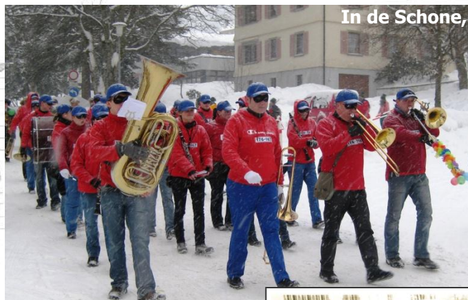
Schmutziger Donnerstag 2010