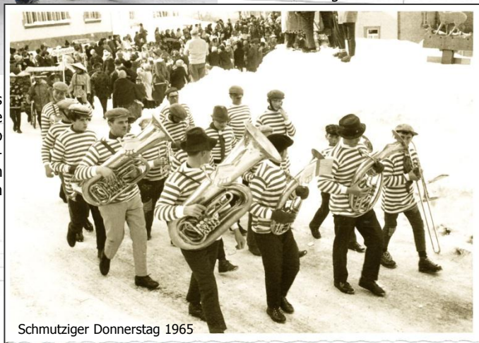
Schmutziger Donnerstag 1965

Vergangenes Jahr waren wir als Panzerknacker unterwegs, wie man sie aus den Donald Duck Comics kennt. So waren wir schon mal verkleidet- allerdings ist es ein paar Jahre her. Ein Musikkollege fand in seinem Archiv ein Beweisfoto aus dem Jahr 1965.